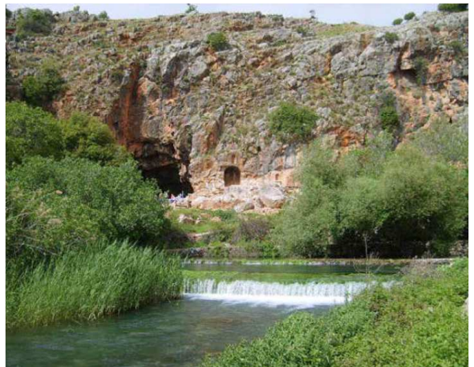
L'ancienne Césarée de Philippe sur le plateau du Golan, où Pierre a déclaré Jésus « le Messie, le Fils du Dieu Vivant » dans Matthieu 16 :16

Ajoutons que certains disent qu'il y a « deux poids deux mesures » quand il s'agit de la réponse des Etats-Unis à l'annexion de la péninsule de Crimée par la Russie, que les russes pourraient s'en servir pour légitimer leur annexion de la Crimée, sans compter que le plan de paix en serait rendu considérablement plus difficile. »