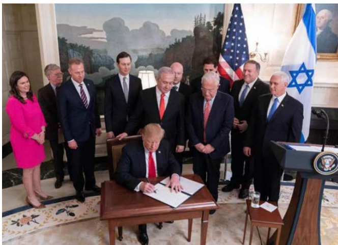
Le Président Donald J. Trump, en présence du Vice-Président, Mike Pence et du Premier Ministre israélien Benjamin Netanyahu, signe la proclamation reconnaissant formellement la souveraineté d'Israël sur le Plateau du Golan, lundi 25 mars 2019, dans la salle de réception diplomatique de la Maison Blanche

L e Président Trump a resserré d'un nouveau cran la ceinture de sa politique étrangère lundi 25 mars, en signant une proclamation qui reconnaît officiellement la souveraineté d'Israël sur le Plateau du Golan, pris à la Syrie en 1967 et qu'il contrôle depuis.