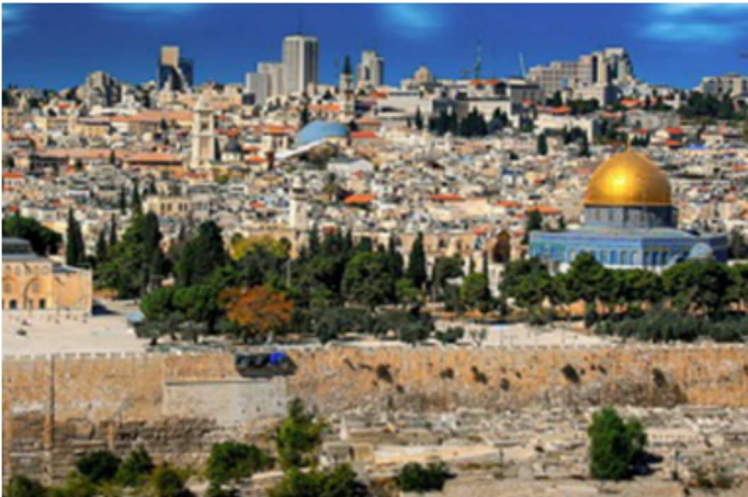
Le mont du temple, Jérusalem