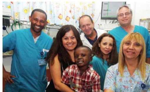
Les équipes médicales de SACH - infirmières et chirurgiens - soignent les enfants. Actuellement, il y a plus de 80 volontaires médicaux.

En ce moment, 44 enfants sont soignés gratuitement au Centre Médical Edith Wolfson à Holon.