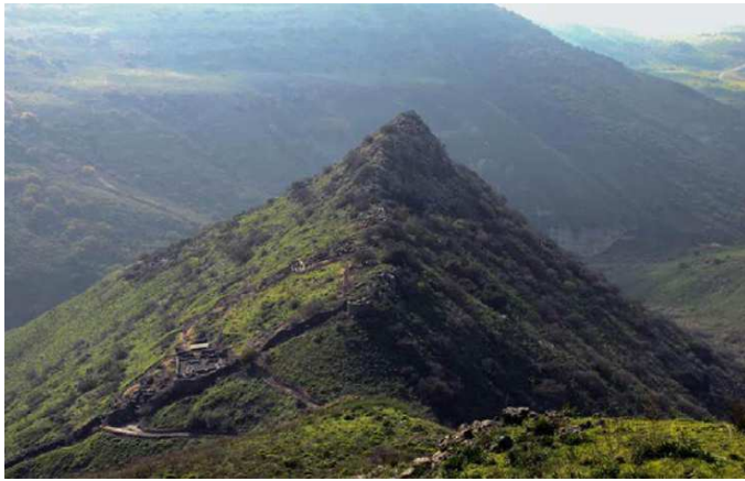
La cité ancienne de Gamla, dans le Golan, découverte par des archéologues après la Guerre des Six Jours (1967) est le site de la bataille décrite dans les « guerres Juives » contre l'Empire Romain de Flavius Josèphe. Il y a ici l'une des plus vieilles synagogues d'Israël, où Jésus a sans doute enseigné. (Matthieu 4 :23-34)

Le Premier Ministre Netanyahu a également remercié le Président Trump pour le déplacement controversé de l'ambassade des EU de Tel Aviv à Jérusalem en mai dernier et pour son retrait de l'Accord Nucléaire avec l'Iran.