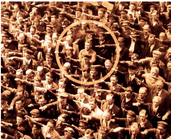
Il ne fléchit pas

« ... un allemand, Auguste Landmesser ... ne fit pas le salut à Hitler lors d'un rassemblement public en 1936. Il passa outre l'antisémitisme qui se répandait dans tout le pays. Il paya le prix, mais il se tint seul, debout ... et sans saluer. » ( http://all-that-is-interesting.com/august-landmesser-no-salute-hitler ).