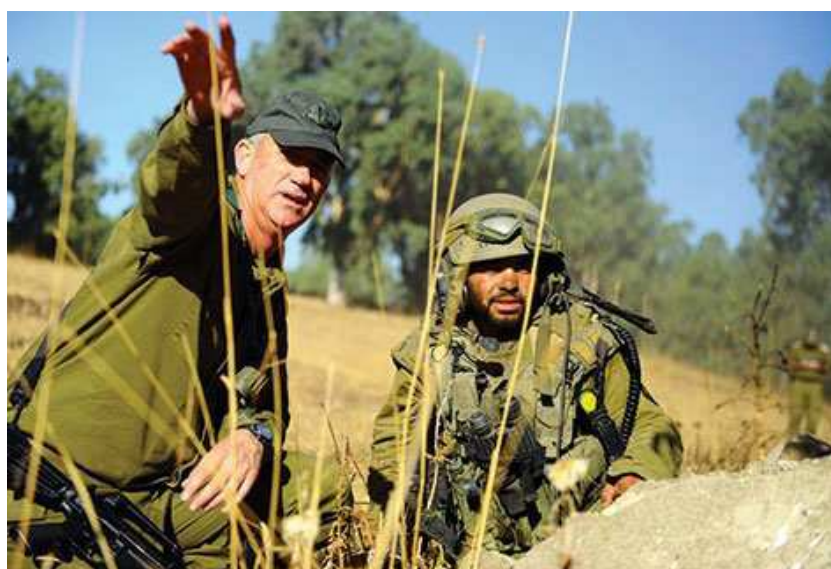
Chef d'Etat-Major Benny Gantz visite un Bataillon Golani en exercice sur les hauteurs du Golan

Continuez à prier! Ci-dessous, voici un article de la Presse Juive pour votre information.