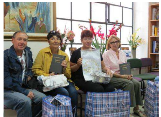
Des Juifs du Cuba et de l'Ukraine retournent à la Terre Promise !

Ce mois-ci, des Juifs revenant de Cuba ont augmenté en nombre également, des familles entières arrivent et n'attendent pas trop longtemps pour nous rendre visite.