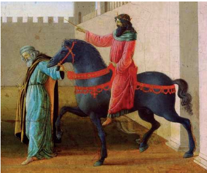
L'orgueil d'Haman contre les Juifs provoqua sa chute.

En arrivant en Israël en 1985, une survivante de l'Holocauste me repoussa en disant : « Ne m'approchez pas. Votre peuple a fermé ses portes et ses volets sur mon peuple...je ne veux rien avoir à faire avec vous. » Il lui a fallu des années pour apprendre à me faire confiance. Finalement, elle se rendit compte que je n'étais pas comme les chrétiens qu'elle avait rencontrés lors de la Seconde Guerre Mondiale. Il lui a fallu 2 ans de patience pour voir la différence. Alors elle a commencé à découvrir quelqu'un qui marchait avec Jésus.