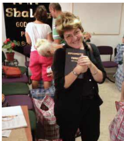
La Parole de Dieu, son plus beau cadeau