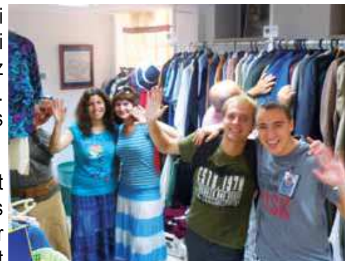
Nouveaux venus au Centre de Distribution