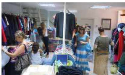
Les vêtements venant des nations, portés à Jérusalem