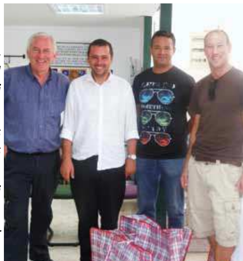
Nouveaux arrivés de Grande Bretagne