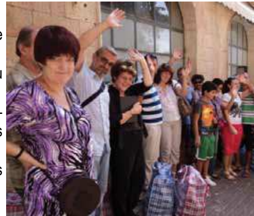
Regard sur leur héritage spirituel